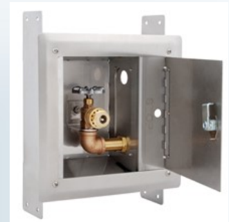
“Caja de Seguridad”